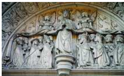
Nossa Senhora é a Medianeira de todas as graças. É através d'Ela que sobem a Deus todos os pedidos feitos pelos homens.

Assim, num momento crucial da escolha entre um caminho ou outro, é indispensável que cada um, para escolher bem, procure conhecer da melhor maneira possível aquilo que há de mais autenticamente belo na Terra.