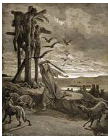
Resfa protegeu das feras os corpos de seus filhos durante seis meses, até o Rei David autorizar que fossem enterrados

Resfa(13) foi esposa de Saul. Ocorreu que após a morte de Saul