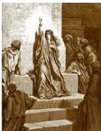
Débora: profetizou a Barac, comandante do exército dos israelitas, que derrotaria o chefe do exército do rei de Canaã

Débora é uma mulher extraordinária do primeiro período da época dos Juízes. Ela nos é apresentada pela Sagrada Escritura como profetiza, juíza do povo, libertadora de Israel e poetiza.