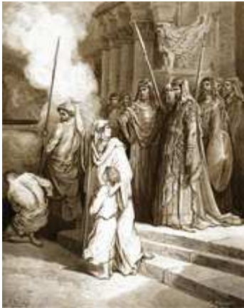
Os Macabeus foram animados por sua admirável mãe para o martírio. Eles são, até certo ponto, prefigura de Nosso Senhor Jesus Cristo, o Mártir dos mártires. E a mãe é uma prefigura de Nossa Senhora

Palavras da mãe dos Macabeus(14) ao seu filho mais novo: “Meu filho, pelo amor que me tens, pois que te trouxe em meu seio, amamentei e nutri até hoje... olha o céu... não temas o carrasco, mostra-te digno de teus irmãos e recebe a morte de bom coração, a fim de que, pela misericórdia de Deus, possa eu tornar a ver-te na glória que esperamos” (2 Mac 7,27-29).