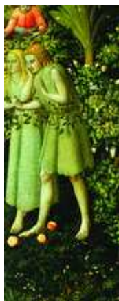
Adão e Eva expulsos do Paraíso. Eva é a mais antiga prefigura de Nossa Senhora

Na ordem dos tempos, Eva — a mãe comum de todos homens — é a primeira figura de Nossa Senhora.