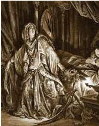
Judite: com a própria espada de Holofernes, corta-lhe a cabeça e liberta Israel

Judite era viúva, já por um período de três anos e seis meses. Nesse período passava a maior parte do tempo em orações e jejuns, juntamente com suas criadas, exceto nas épocas de festas de Israel. Era de belíssimo aspecto, possuía muitas riquezas. Além disso era estimadíssima de todos, porque era temente a Deus e não dava ocasião a que ninguém dissesse dela uma palavra em desabono.